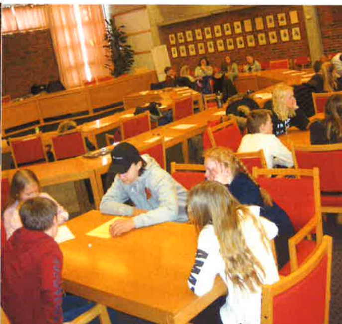
Bildet over: Gruppearbeid på BUK-møtet i Kommunestyresalen på rådhuset.